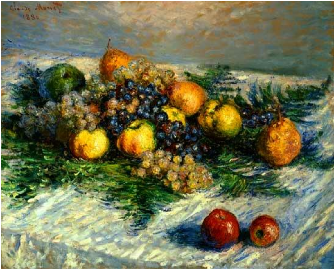
Œuvre du célèbre peintre Monet ; Nature morte « Poires et raisins »