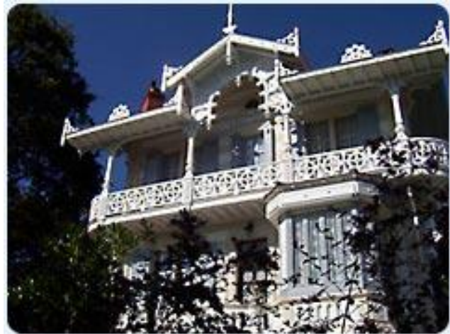
Villa de la Ville d'Hiver