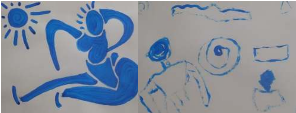
Peintures « atelier création ; à la manière de Matisse »