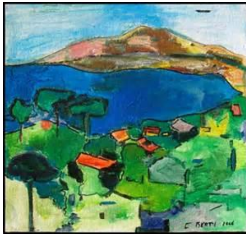
Paysage Catalan par Christian Berté

Le pays Catalan cher à Madame Secall-Bersinger est à l'honneur !!!