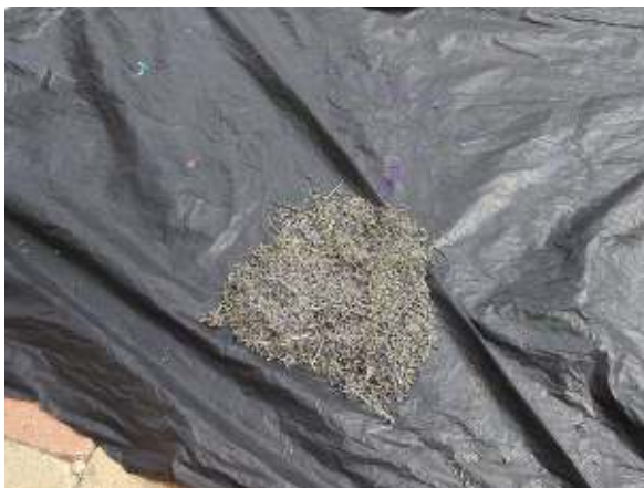
Un peu de lavande récoltée