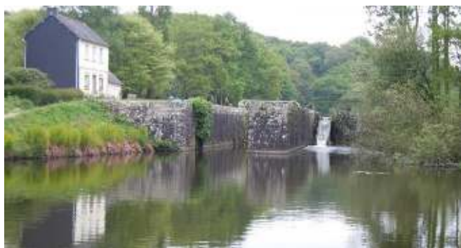
Canal de Nantes à Brest – Écluse de Glomel | Lanzonnet

« Nous avons été voir des danses bretonnes, la fête des moissons, les vieux tracteurs, vieilles voitures et motos qui roulent encore !!!, les écluses. Dans un bateau nous avons parcouru le canal de Brest, et vu bien d'autres choses à marée haute et à marée basse. En plus de tout cela, la nourriture était bonne. »