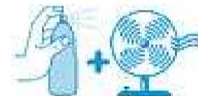
Je mouille mon corps et je me ventile