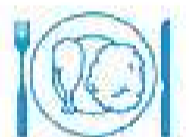
Je mange en quantité suffisante