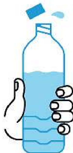
JE BOIS RÉGULIÈREMENT DE L'EAU

En période de canicule, quels sont les bons gestes?