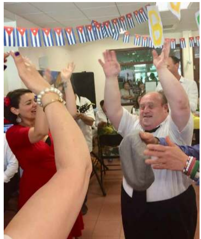
SORTIE AU BURGER KING