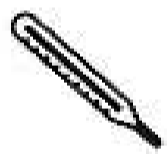
Fièvre > 38°C