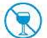
Je ne bois pas d'alcool