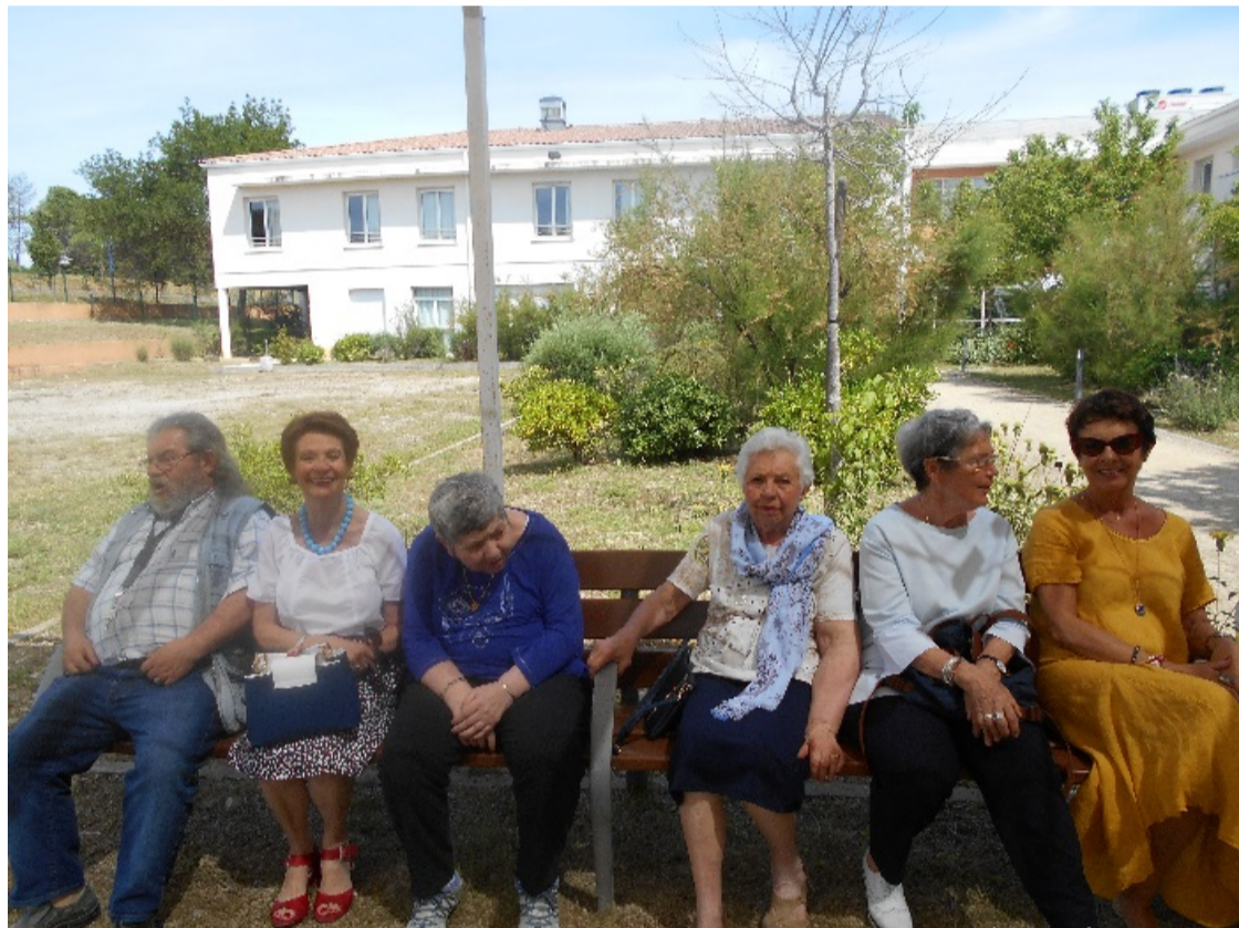
LUDOTHEQUES EN PLEIN AIR À POMPIGNAN