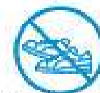
J'évite les efforts physiques