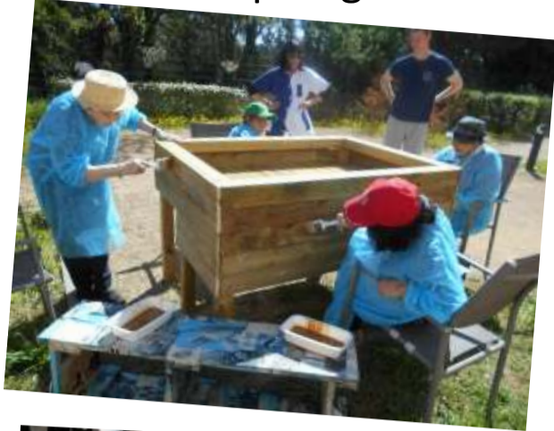
Atelier carré potager